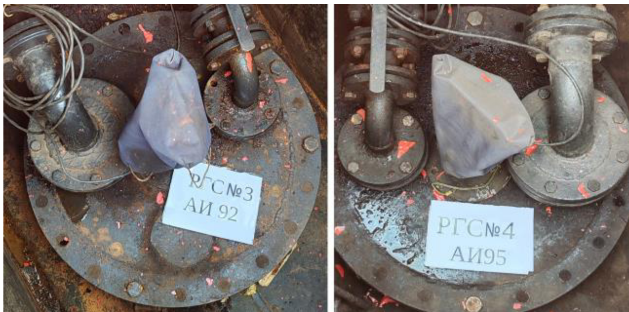
Рисунок 2 – Горловины резервуаров РГС-60 зав.№№ 3, 4