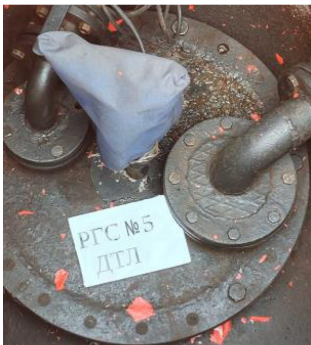
Рисунок 3 – Горловина резервуара РГС-60 зав.№ 5

Пломбирование резервуаров РГС-60 не предусмотрено.