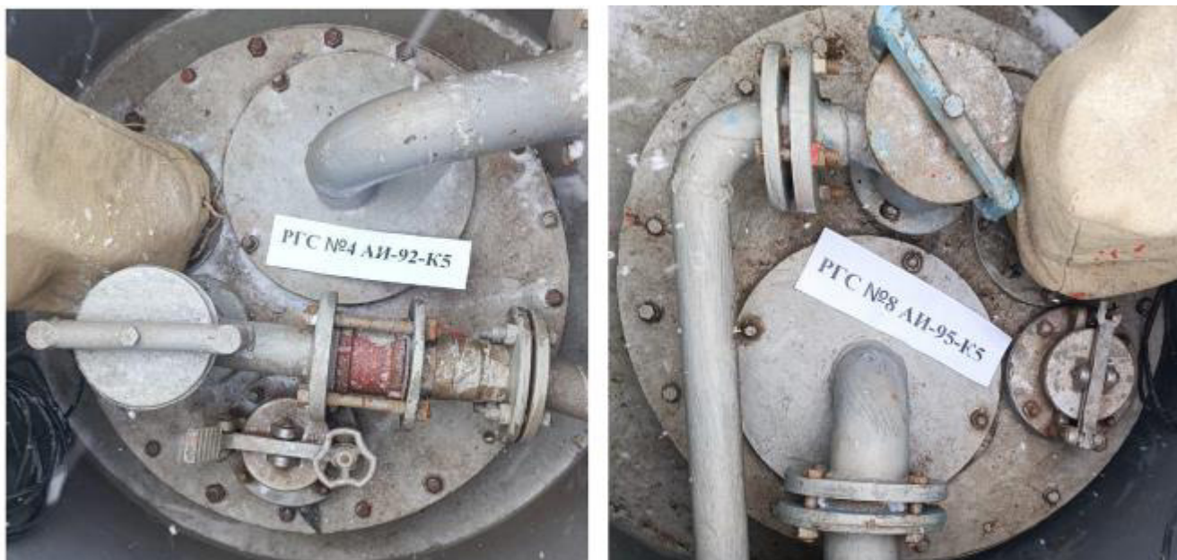
Рисунок 3 – Горловины резервуаров РГС-25 зав.№№ 4, 8

Пломбирование резервуаров РГС-25 не предусмотрено.