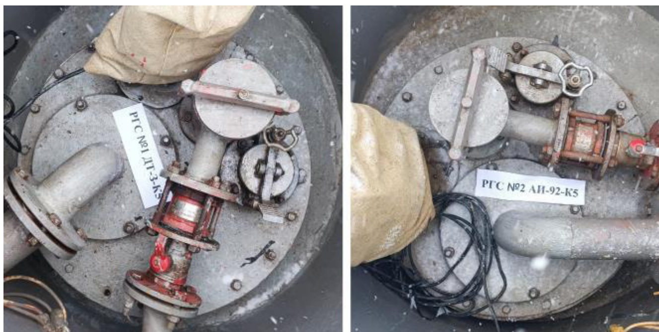
Рисунок 2 – Горловины резервуаров РГС-25 зав.№№ 1, 2