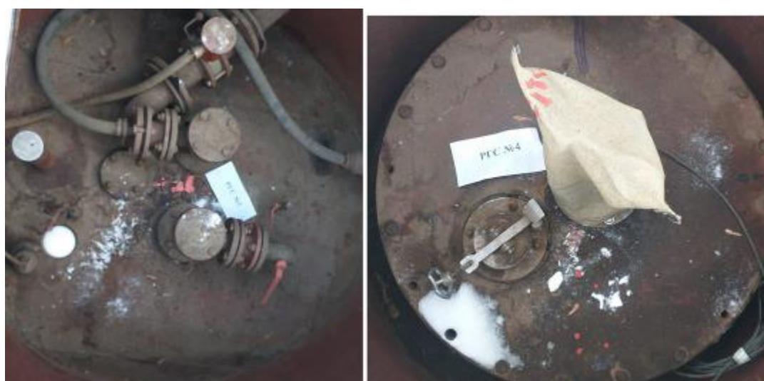
Рисунок 3 – Горловины резервуаров РГС-28 зав.№№ 3, 4 Пломбирование резервуаров РГС-28 не предусмотрено.