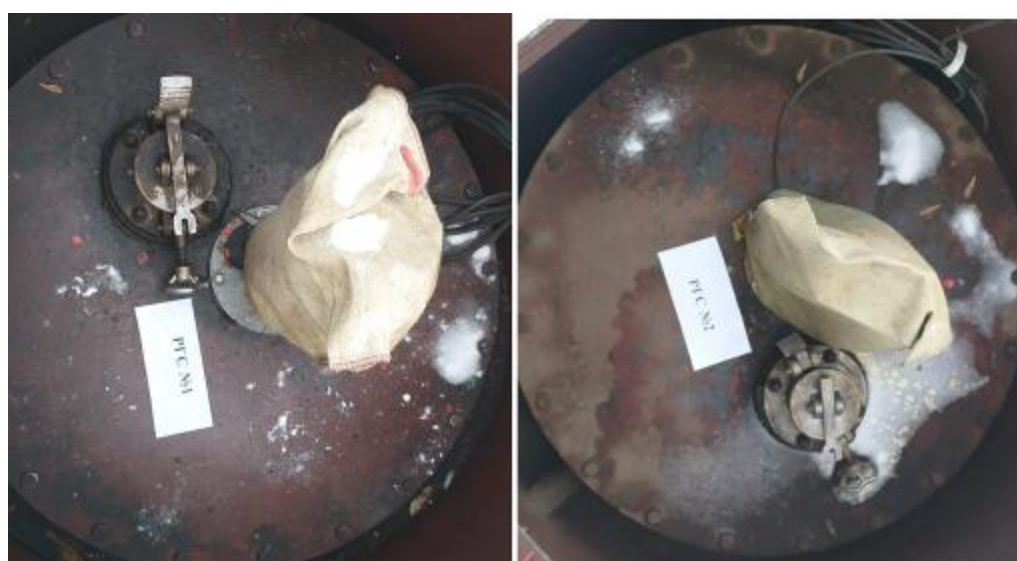
Рисунок 2 – Горловины резервуаров РГС-28 зав.№№ 1, 2