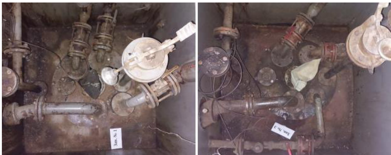
Рисунок 2 – Горловины резервуаров РГС-50 зав.№№ 1, 3