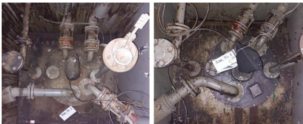
Рисунок 3 – Горловины резервуаров РГС-55 зав.№№ 2, 4

Пломбирование резервуаров РГС не предусмотрено.