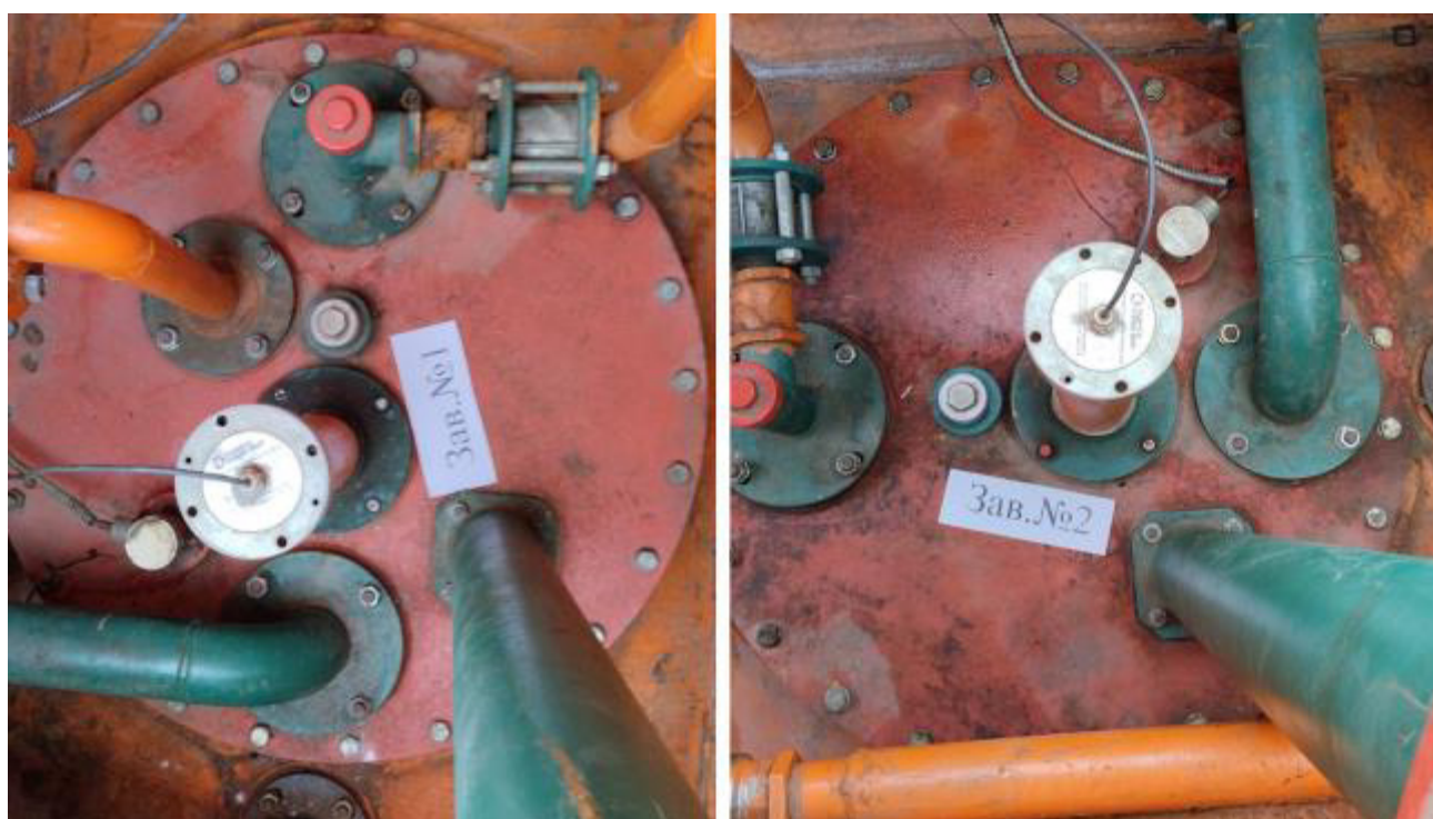
Рисунок 2 – Горловины резервуаров РГС-25 зав.№№ 1, 2