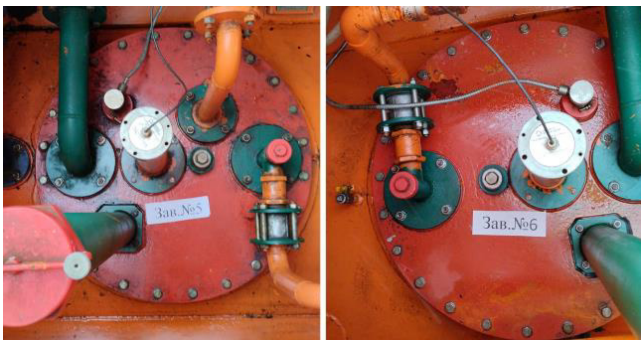
Рисунок 4 – Горловины резервуаров РГС-25 зав.№№ 5, 6

Пломбирование резервуаров РГС-25 не предусмотрено.