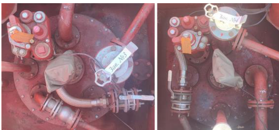
Рисунок 3 – Горловины резервуаров РГС-25 зав.№№ 3, 4

Пломбирование резервуаров РГС-25 не предусмотрено.