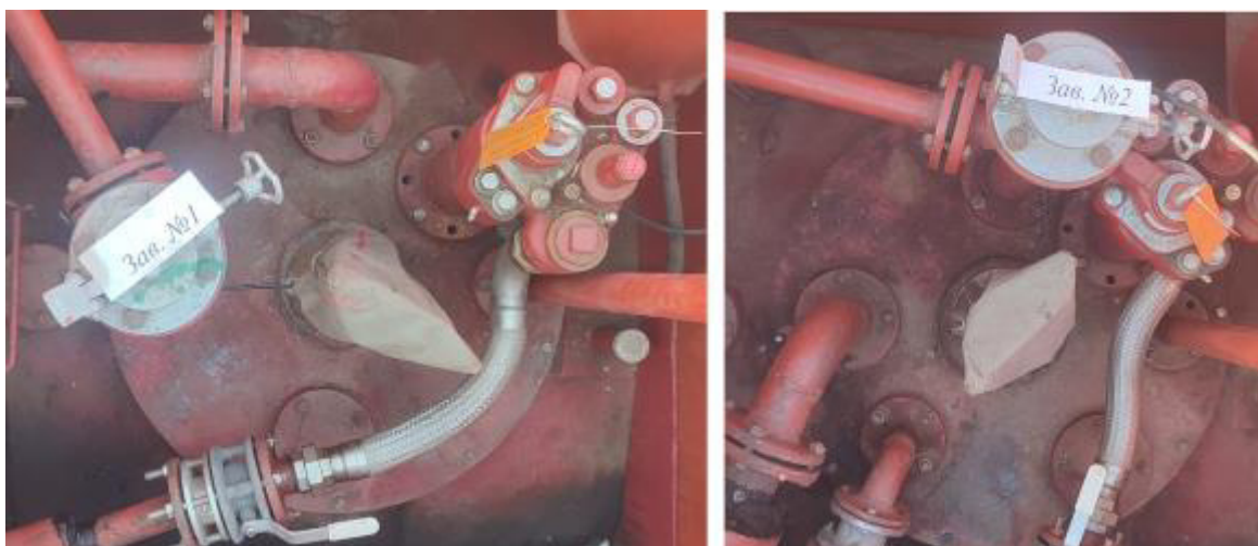
Рисунок 2 – Горловины резервуаров РГС-25 зав.№№ 1, 2