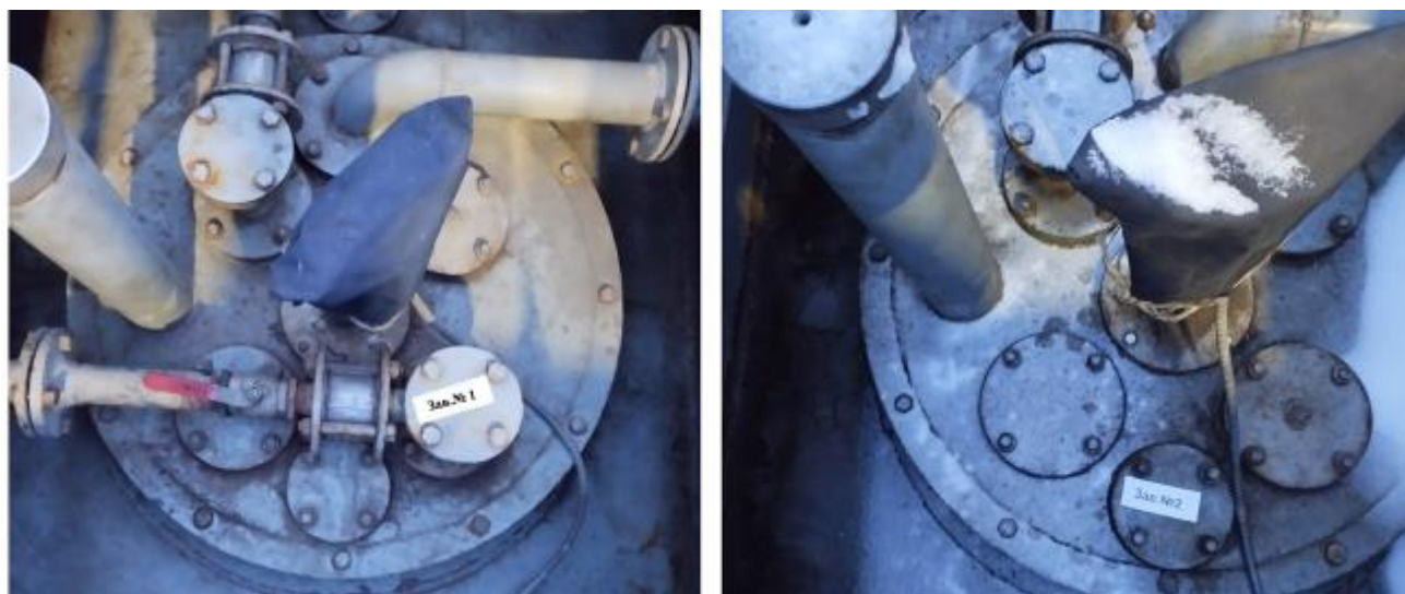
Рисунок 2 – Горловины резервуаров РГС-50 зав.№№ 1, 2