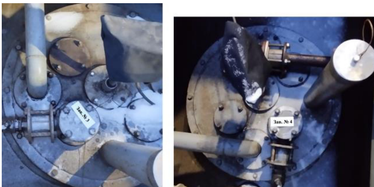
Рисунок 3 – Горловины резервуаров РГС-50 зав.№№ 3, 4

Пломбирование резервуаров РГС-50 не предусмотрено.