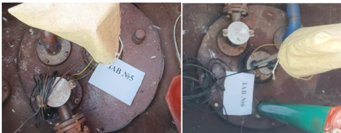
Рисунок 4 – Горловины резервуаров РГС-25 зав.№№ 5, 6