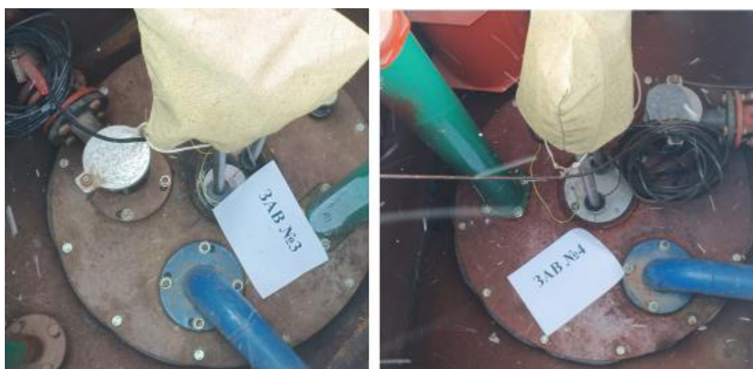
Рисунок 3 – Горловины резервуаров РГС-25 зав.№№ 3, 4