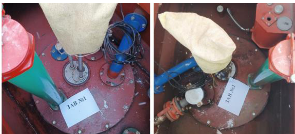
Рисунок 2 – Горловины резервуаров РГС-25 зав.№№ 1, 2