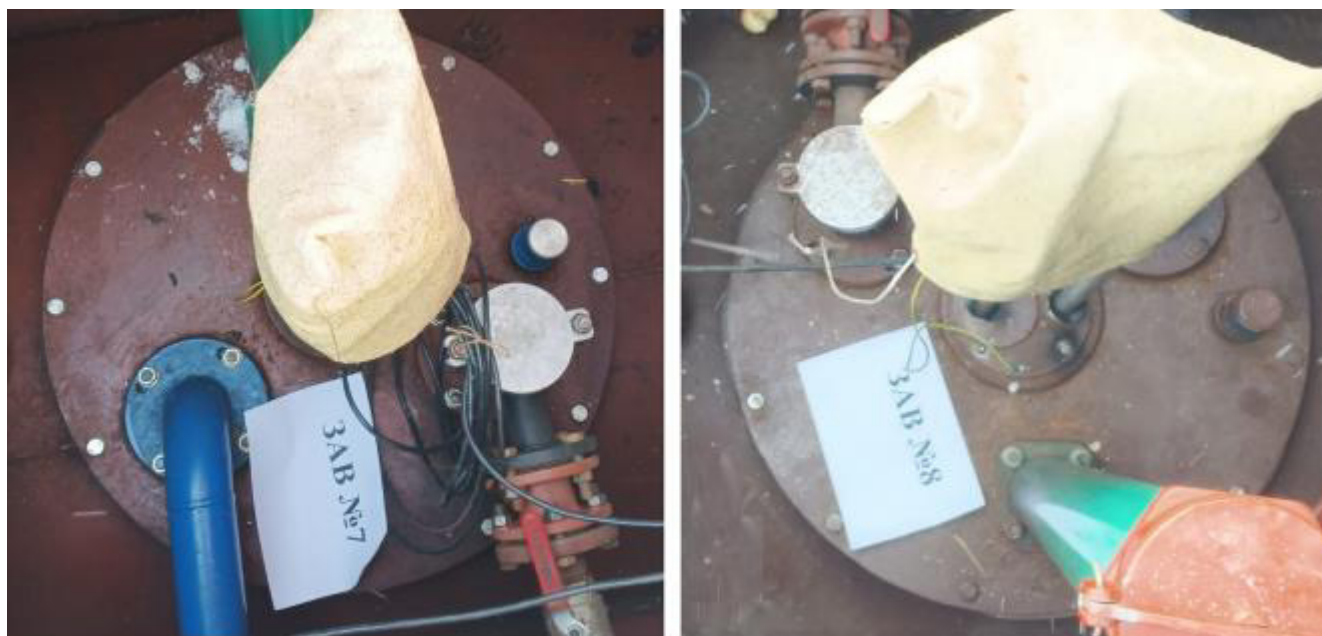
Рисунок 5 – Горловины резервуаров РГС-25 зав.№№ 7, 8

Пломбирование резервуаров РГС-25 не предусмотрено.