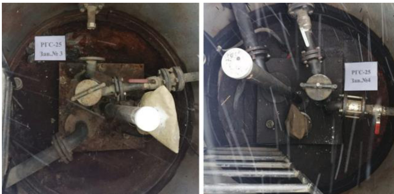
Рисунок 3 – Горловины резервуаров РГС-25 зав.№№ 3, 4

Пломбирование резервуаров РГС-25 не предусмотрено.