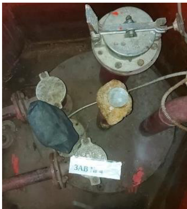
Рисунок 3 – Горловина резервуара РГС-25 зав.№4