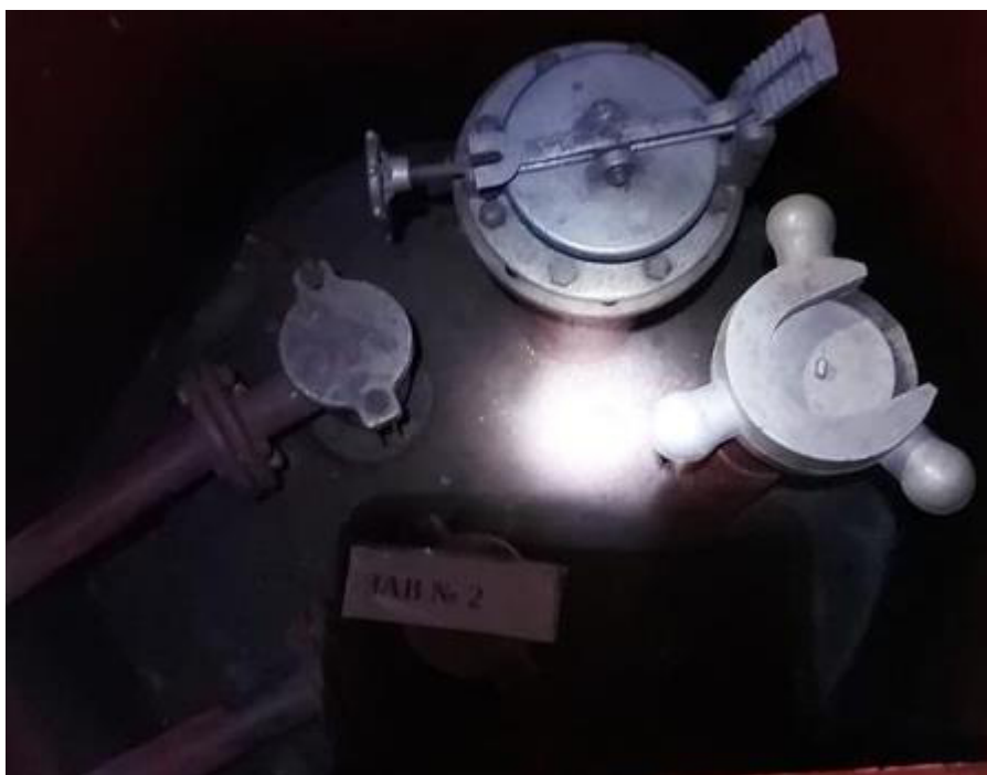
Рисунок 5 – Горловина резервуара РГС-60 зав.№2

Пломбирование резервуаров РГС не предусмотрено.