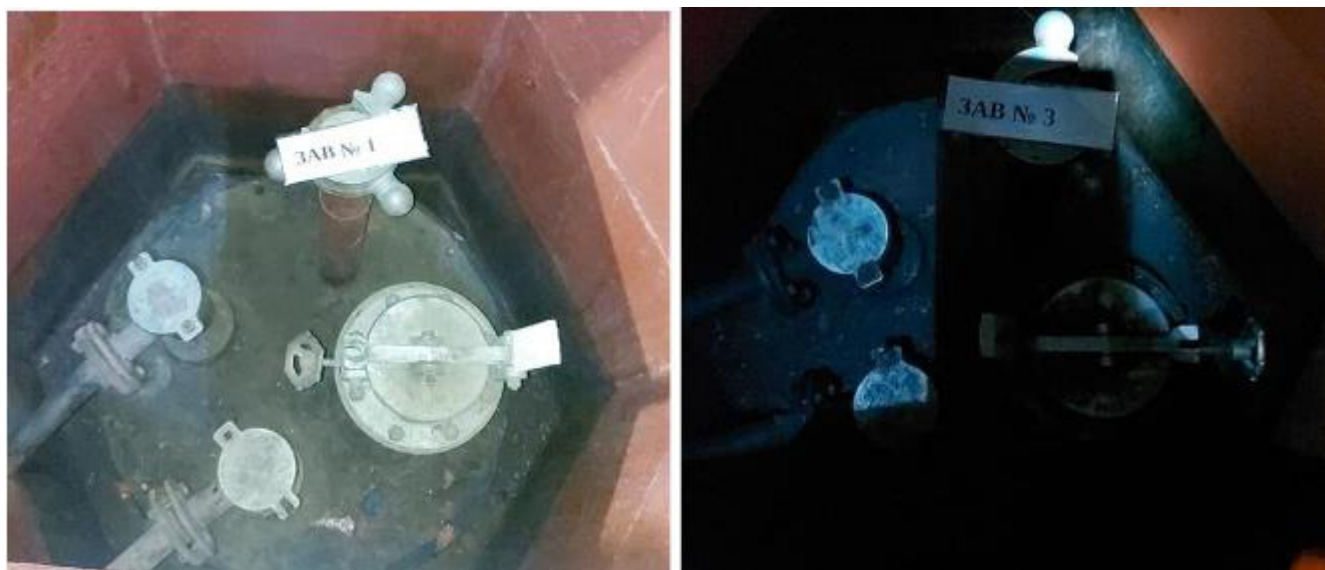
Рисунок 4 – Горловины резервуаров РГС-50 зав.№№1, 3