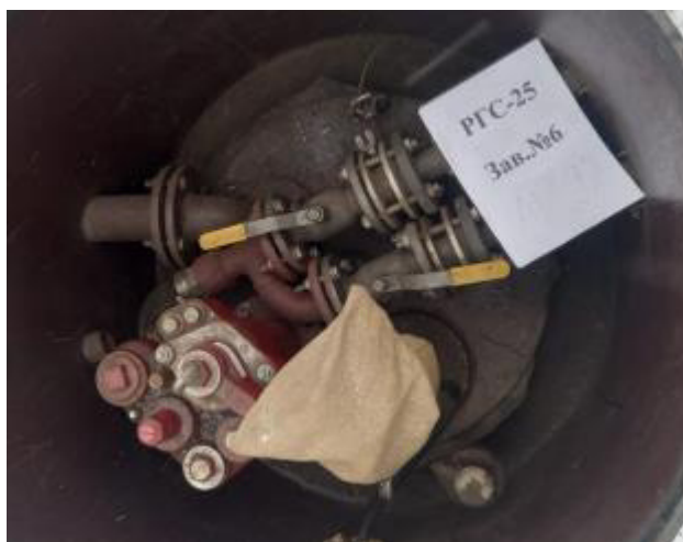
Рисунок 4 – Горловина резервуара РГС-25 зав.№6

Пломбирование резервуаров РГС-25 не предусмотрено.