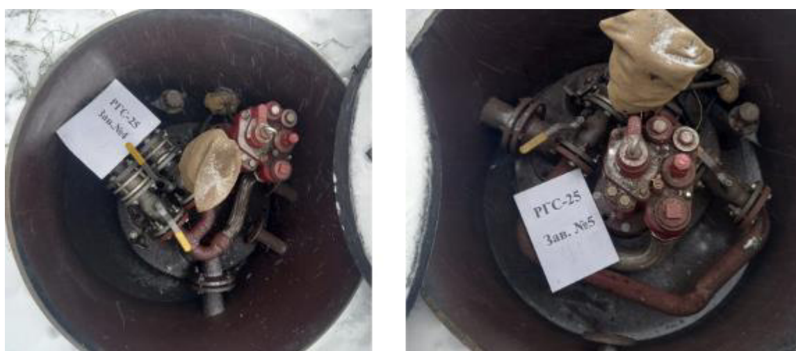
Рисунок 3 – Горловины резервуаров РГС-25 зав.№№ 4, 5