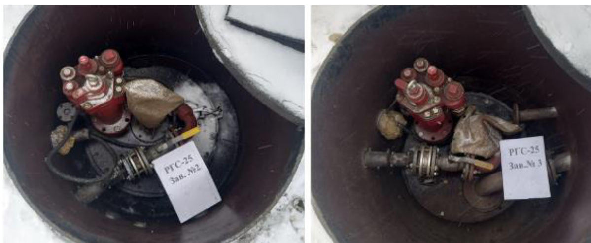
Рисунок 2 – Горловины резервуаров РГС-25 зав.№№ 2, 3