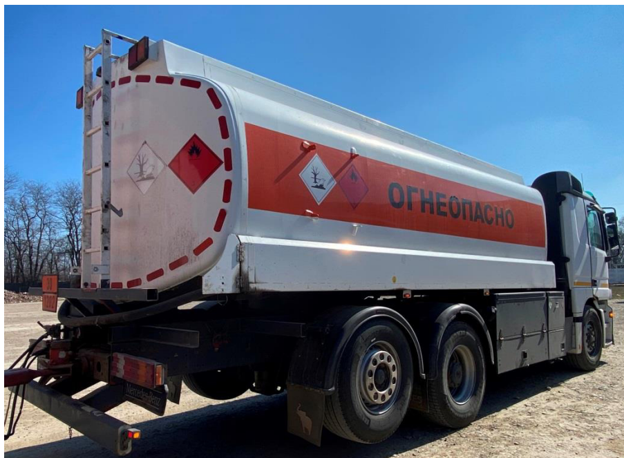
Рисунок 1 – Общий вид автоцистерны MERCEDES-BENZ 2543 ACTROS, заводской номер WDB9502031K822146

Схема пломбировки от несанкционированного изменения положения указателя уровня налива, обозначение места нанесения знака поверки представлены на рисунке 2.