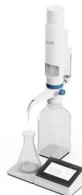
б) диспенсер dTrite с максимальным подъемом поршня 25 и 50 мл