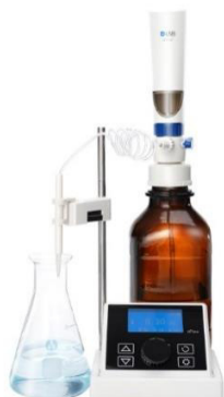
в) диспенсер dFlow