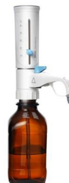
д) диспенсер DispensMate Pro