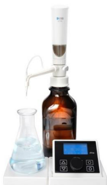
а) диспенсер dTrite с максимальным подъемом поршня 10 мл

Пломбирование и нанесение знака поверки на средство измерений не предусмотрены.