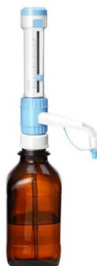
г) диспенсер DispensMate