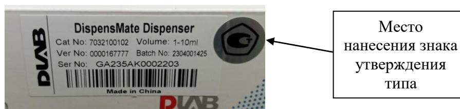
Рисунок 3 – Место нанесения знака утверждения типа