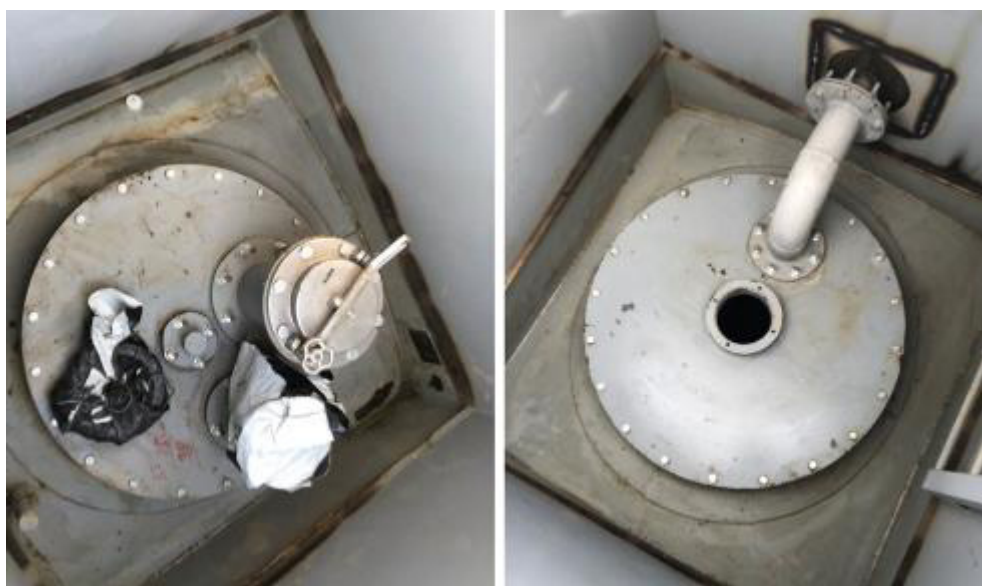
Рисунок 2 – Горловины и измерительный люк резервуара РГСпд-25 зав.№ 0372