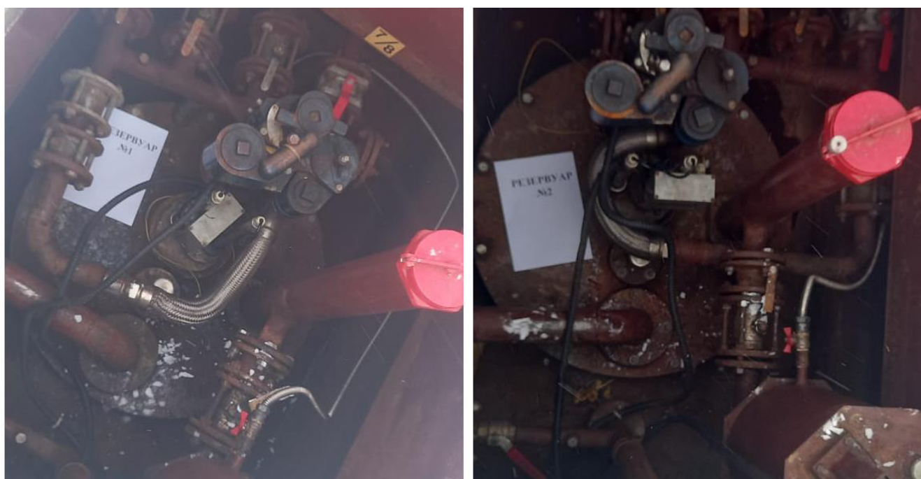
Рисунок 2 – Горловины резервуаров РГС-63 зав.№№ 1, 2