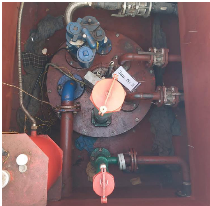
Рисунок 3 – Горловина резервуара РГС-63 зав.№ 3

Пломбирование резервуаров РГС-63 не предусмотрено.