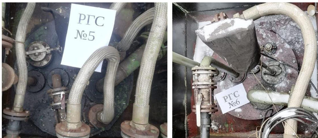
Рисунок 4 – Горловины резервуаров РГС-25 зав.№№ 5, 6