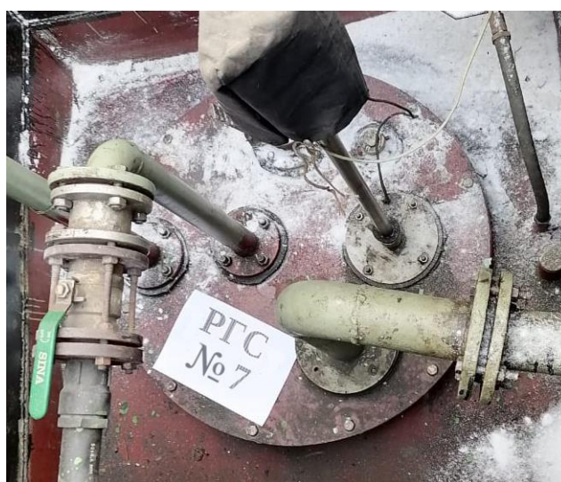
Рисунок 5 – Горловина резервуара РГС-25 зав.№ 7 Пломбирование резервуаров РГС-25 не предусмотрено.