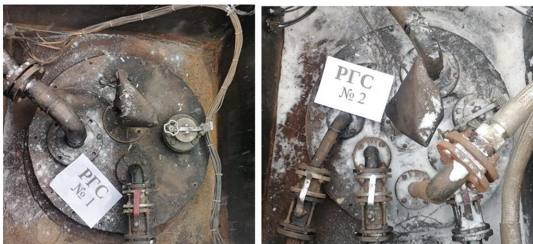
Рисунок 2 – Горловины резервуаров РГС-25 зав.№№ 1, 2