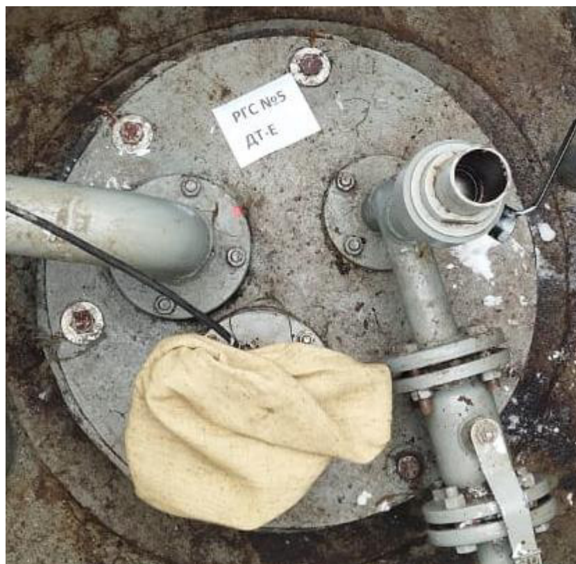
Рисунок 2 – Горловина резервуара РГС-25 зав.№ 5