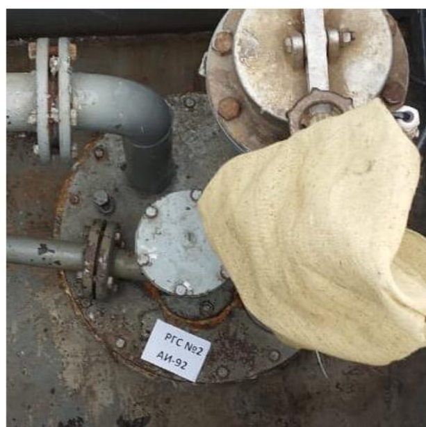
Рисунок 3 – Горловины резервуаров РГС-30 зав.№№ 1, 2