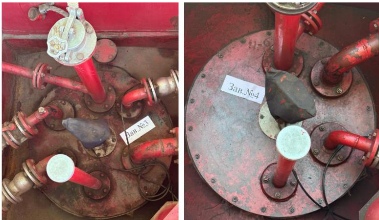
Рисунок 2 – Горловины резервуаров РГС-20 зав.№№ 3, 4