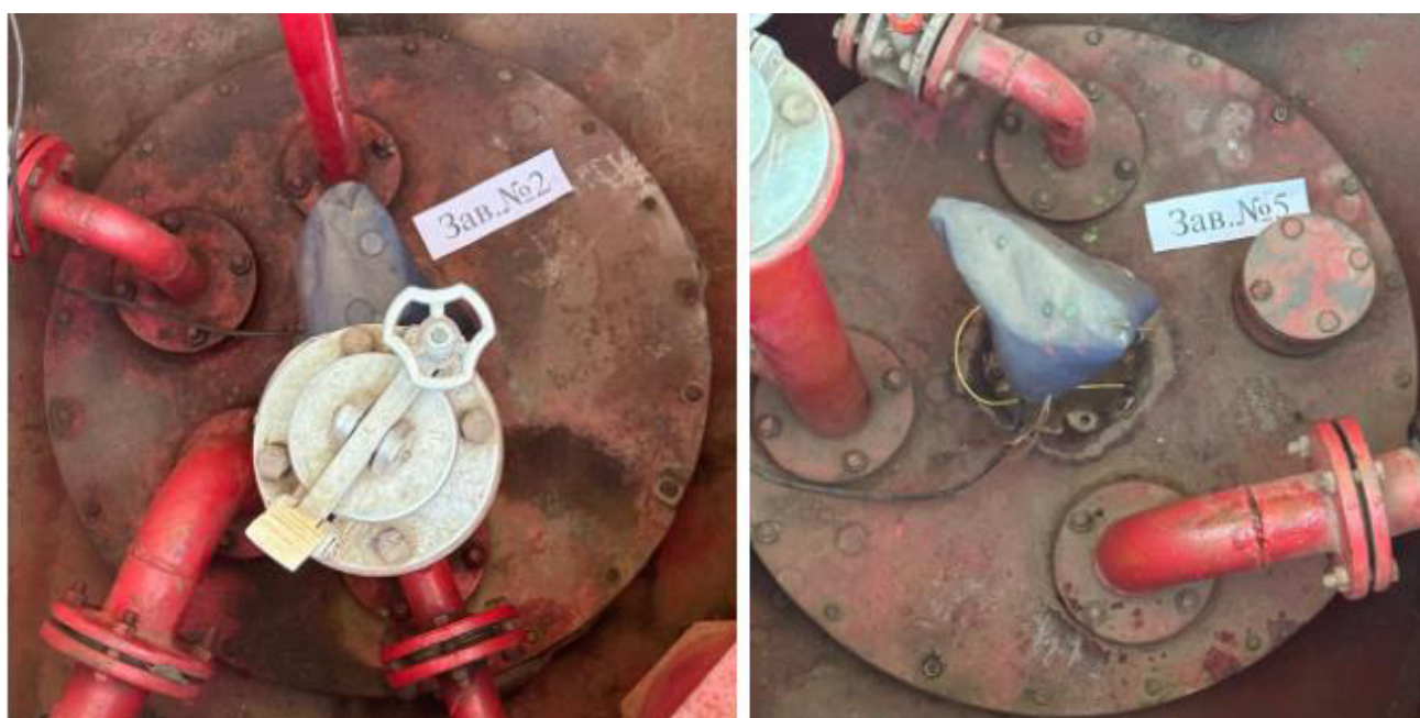
Рисунок 3 – Горловины резервуаров РГС-40 зав.№№ 2, 5 Пломбирование резервуаров РГС не предусмотрено.