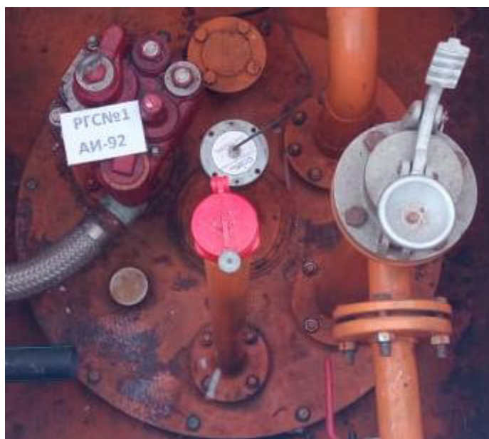
Рисунок 3 – Горловина резервуара РГС-50 зав.№ 1

Пломбирование резервуаров РГС не предусмотрено.