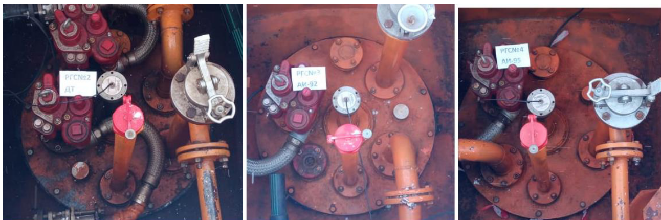
Рисунок 2 – Горловины резервуаров РГС-25 зав.№№ 2, 3, 4