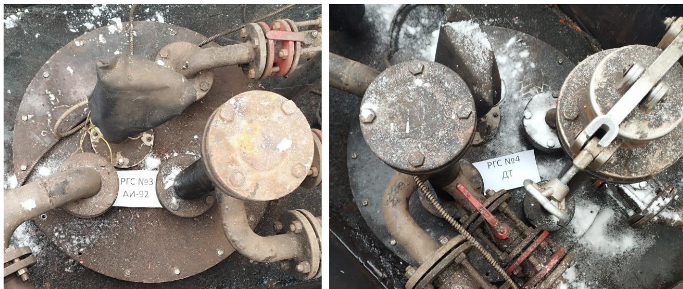
Рисунок 3 – Горловины резервуаров РГС-30 зав.№№ 3, 4 Пломбирование резервуаров РГС-30 не предусмотрено.