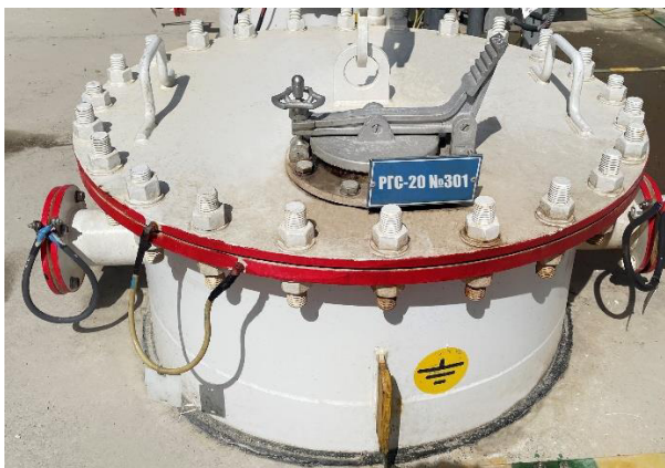
Рисунок 2 – Место нанесения заводского номера резервуара РГС-20

Замерной люк резервуара представлен на рисунке 3.