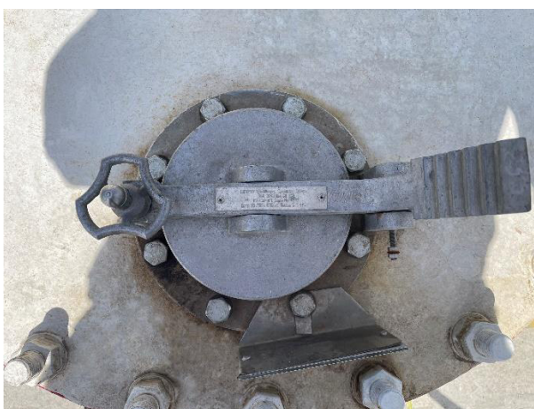
Рисунок 3 – Замерной люк резервуара РГС-20

Замерной люк резервуара представлен на рисунке 3.