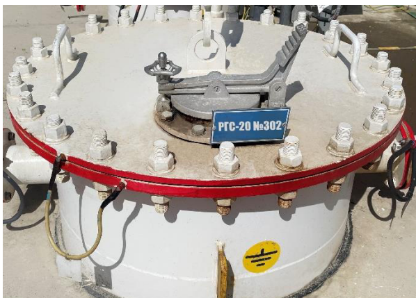
Рисунок 2 – Место нанесения заводского номера резервуара РГС-20

Замерной люк резервуара представлен на рисунке 3.