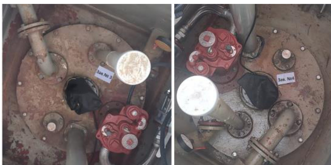
Рисунок 3 – Горловины резервуаров РГС-25 зав.№№ 3, 4