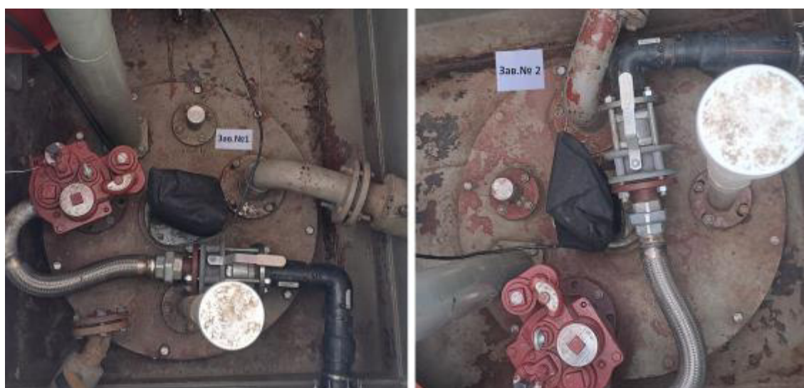
Рисунок 2 – Горловины резервуаров РГС-25 зав.№№ 1, 2