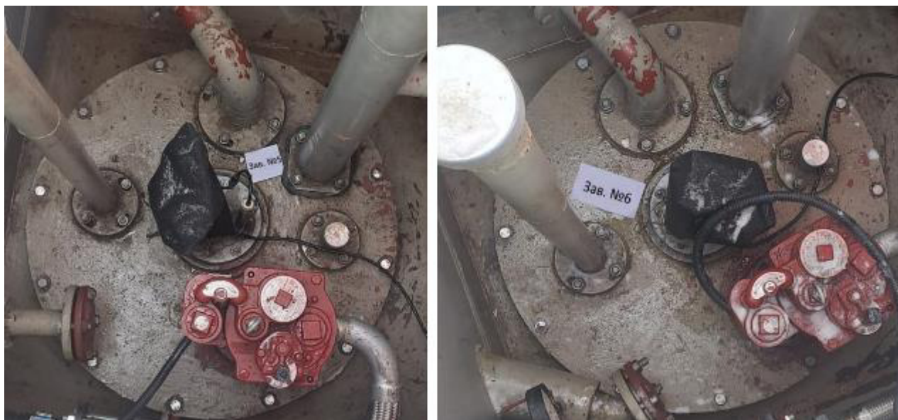
Рисунок 4 – Горловины резервуаров РГС-25 зав.№№ 5, 6

Пломбирование резервуаров РГС-25 не предусмотрено.