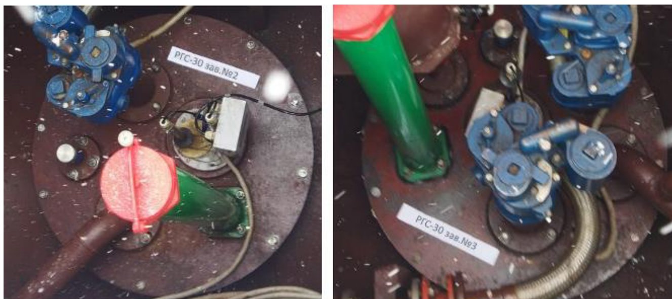
Рисунок 2 – Горловины резервуаров РГС-30 зав.№№ 2, 3