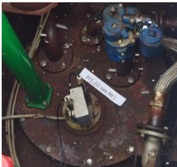
Рисунок 3 – Горловина резервуара РГС-60 зав.№ 1

Пломбирование резервуаров РГС не предусмотрено.