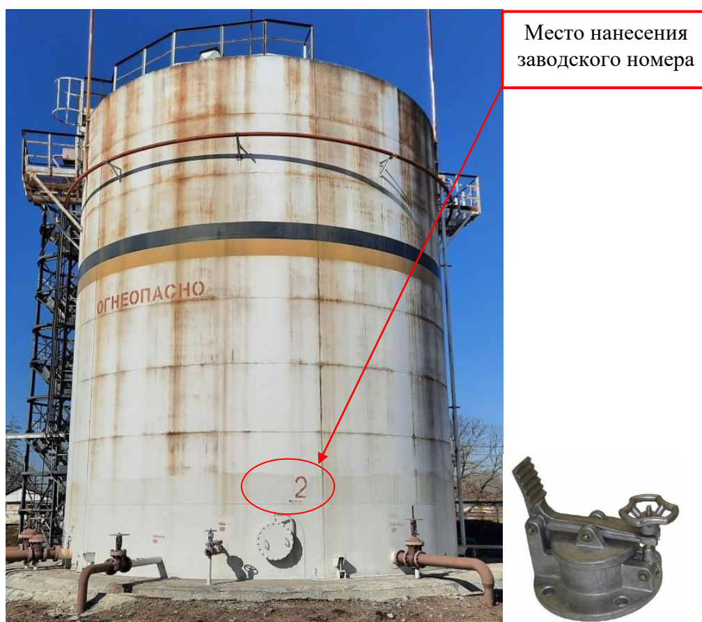
Рисунок 2 – Общий вид резервуара и замерного люка РВС-1000 зав. № 2