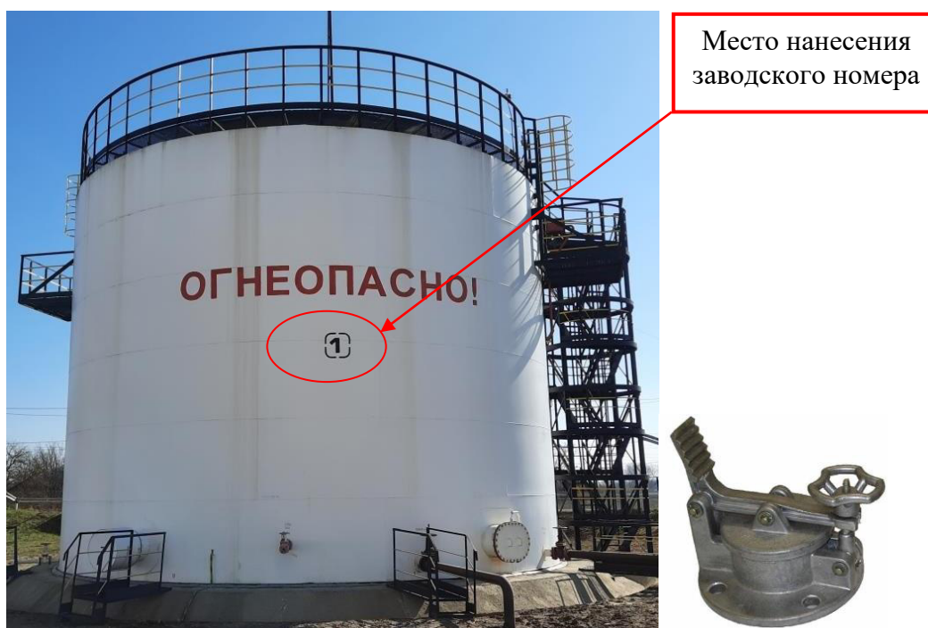
Рисунок 1 – Общий вид резервуара и замерного люка РВС-1000 зав. № 1