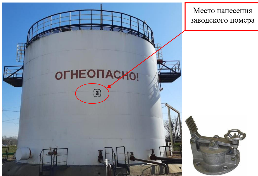
Рисунок 3 – Общий вид резервуара и замерного люка РВС-1000 зав. № 3