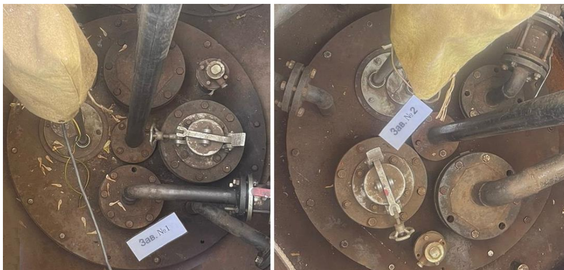
Рисунок 2 – Горловины резервуаров РГС-20 зав.№№ 1, 2