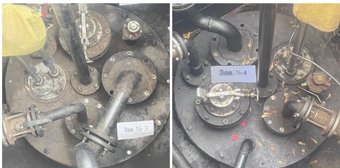
Рисунок 3 – Горловины резервуаров РГС-20 зав.№№ 3, 4

Пломбирование резервуаров РГС-20 не предусмотрено.