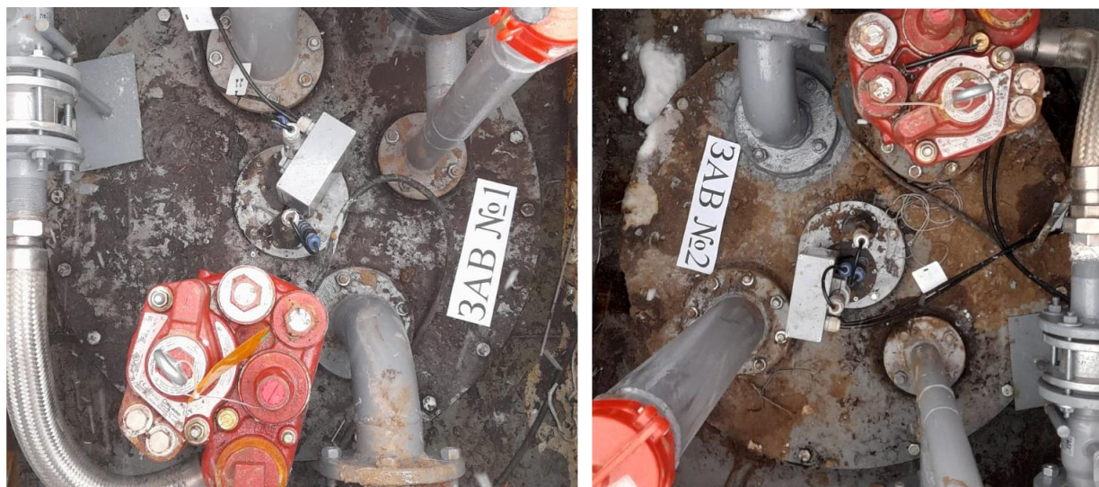
Рисунок 2 – Горловины резервуаров РГС-25 зав.№№ 1, 2