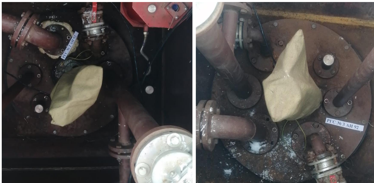
Рисунок 2 – Горловины резервуаров РГС-25 зав.№№ 2, 3