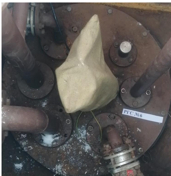
Рисунок 4 – Горловина резервуара РГС-25 зав.№ 6

Пломбирование резервуаров РГС-25 не предусмотрено.