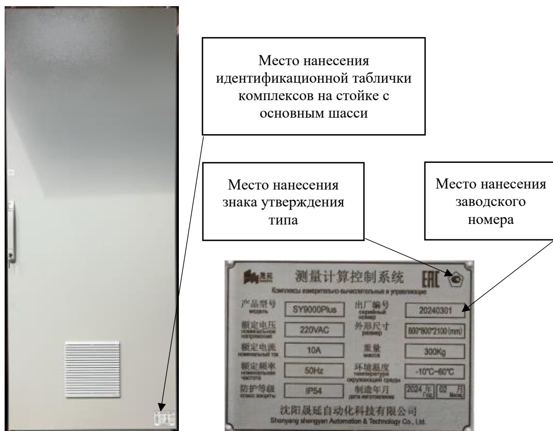
Рисунок 2 – Вид комплексов с указанием мест нанесения идентификационной таблички комплексов, общий вид идентификационной таблички комплексов с местом нанесения заводского номера и знака утверждения типа