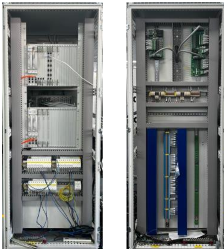
Рисунок 1 – Общий вид стойки с основным шасси комплексов