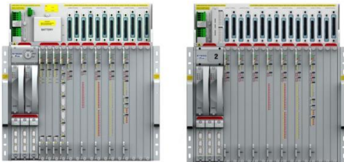
Рисунок 3 – Общий вид основного шасси и шасси расширения