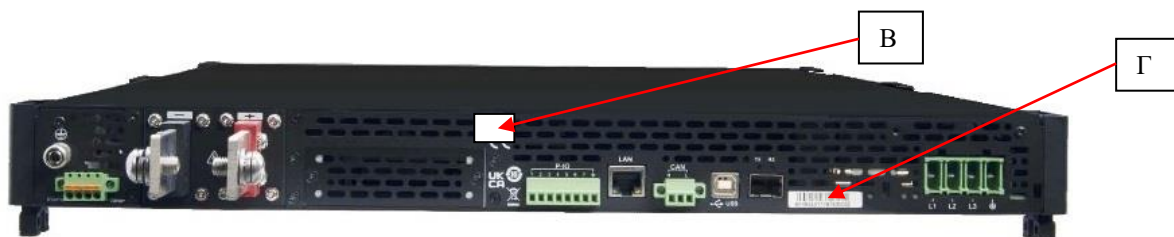
Рисунок 2 – Вид задней панели источников, место пломбировки от несанкционированного доступа (В) и место нанесения серийного номера (Г)