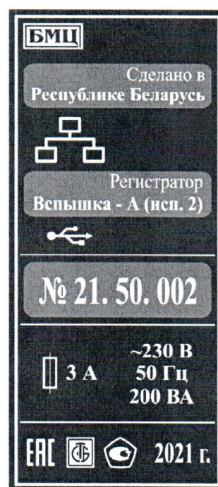
б) исполнение 2