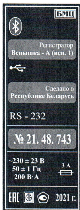
а) исполнение 1