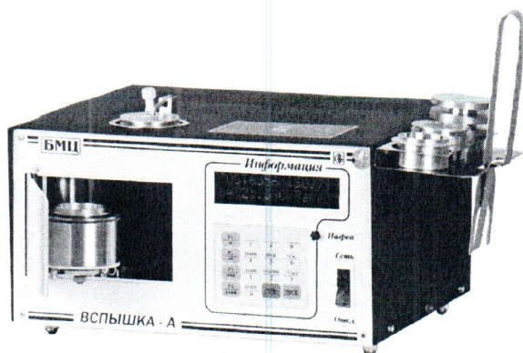
а) исполнение 1