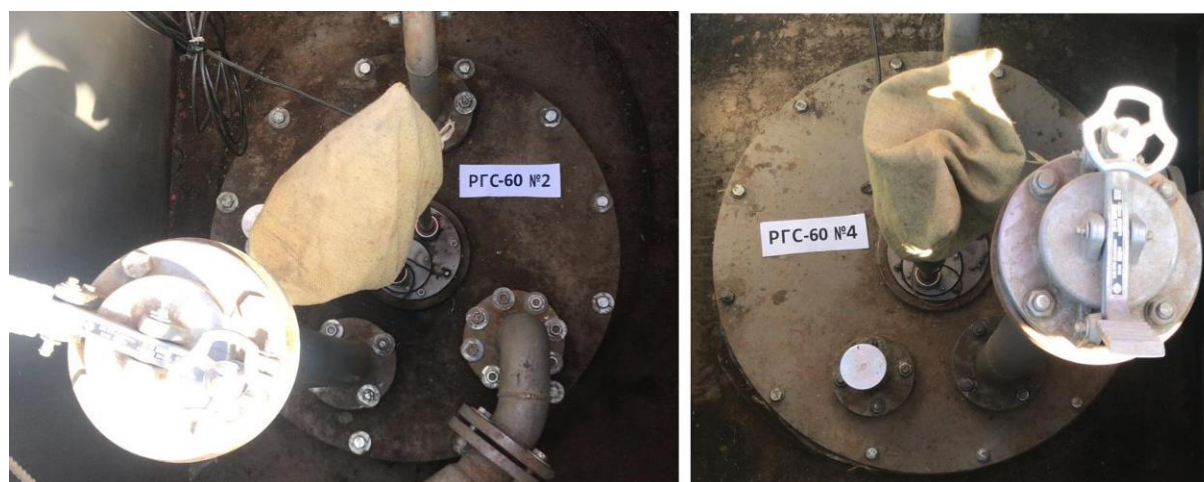
Рисунок 3 – Горловины резервуаров РГС-60 зав.№№ 2, 4

Пломбирование резервуаров РГС не предусмотрено.