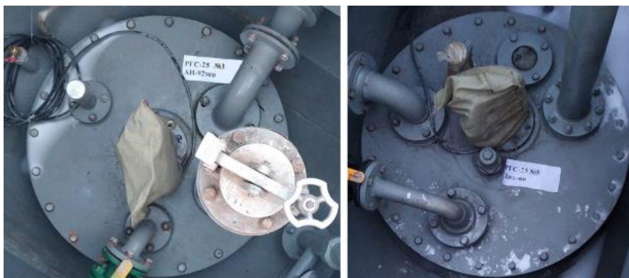
Рисунок 3 – Горловины резервуаров PFC-25 зав.№№ 3, 5