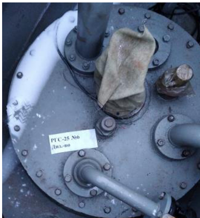
Рисунок 4 – Горловина резервуара РГС-25 зав.№ 6

Пломбирование резервуаров РГС-25 не предусмотрено.