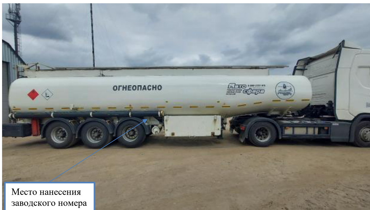
Рисунок 1 – Общий вид полуприцепа-цистерны INDOX зав.№ VS96T7365VT047017 с указанием места нанесения заводского номера