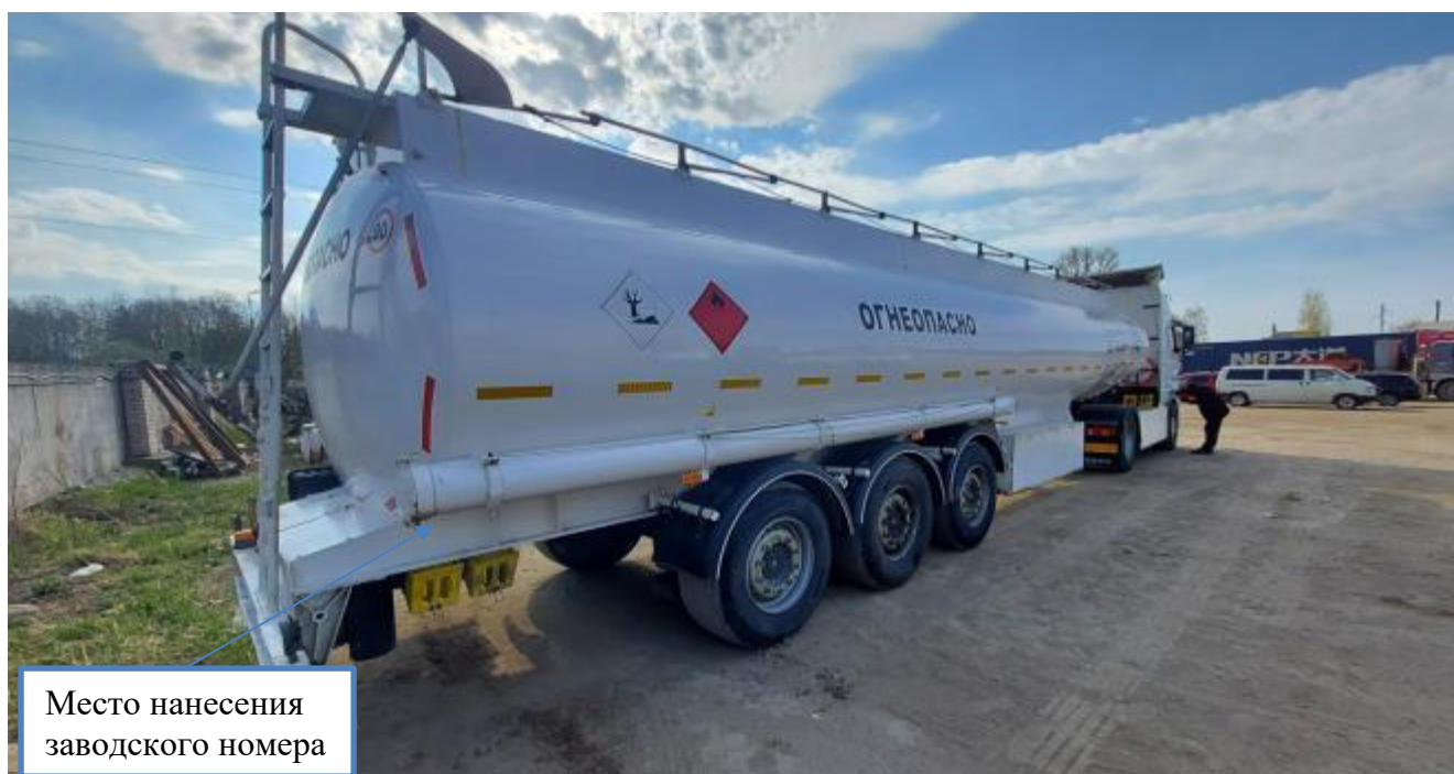
Рисунок 2 – Общий вид полуприцепа-цистерны INDOX зав.№ VWLAL30VA2T010261 с указанием места нанесения заводского номера

Схема пломбировки для защиты от несанкционированного изменения положения уровня налива, обозначение места нанесения знака поверки представлены на рисунке 3.