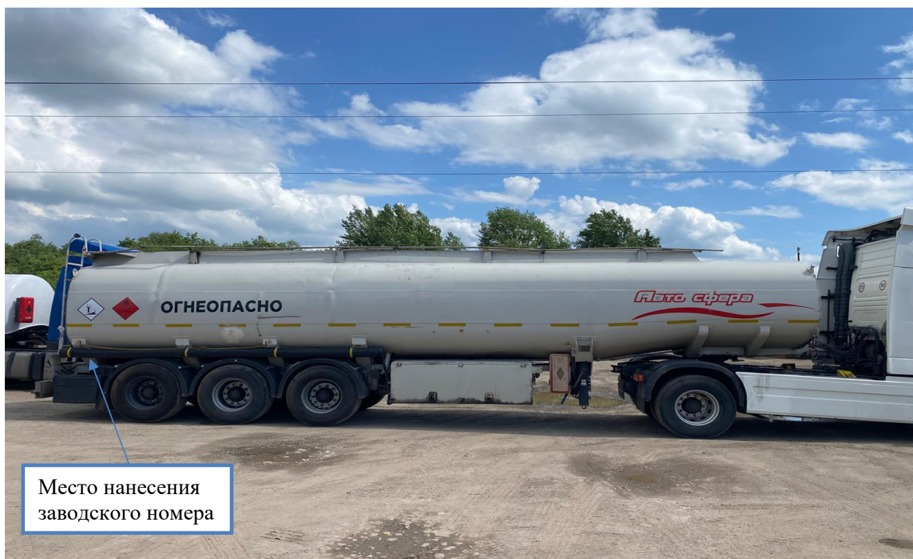
Рисунок 1 – Общий вид полуприцепа-цистерны SILVA зав.№ VS9CAN406XR072754 с указанием места нанесения заводского номера