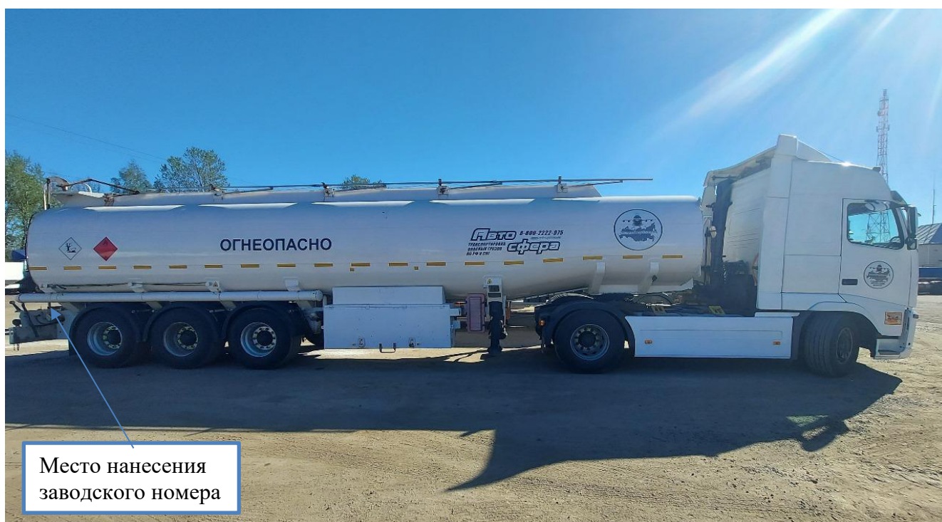
Рисунок 2 – Общий вид полуприцепа-цистерны SILVA зав.№ VS9CAN406YR072775 с указанием места нанесения заводского номера

Схема пломбировки для защиты от несанкционированного изменения положения уровня налива, обозначение места нанесения знака поверки представлены на рисунке 3.