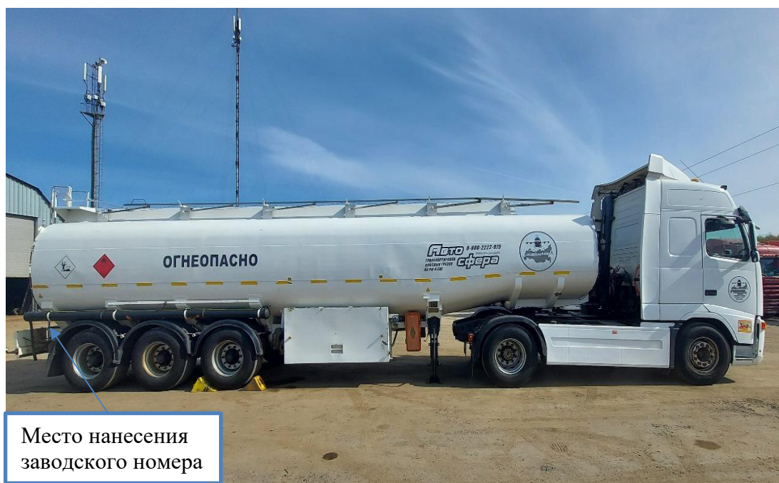
Рисунок 1 – Общий вид полуприцепа-цистерны SILVA с указанием места нанесения заводского номера

Схема пломбировки для защиты от несанкционированного изменения положения уровня налива, обозначение места нанесения знака поверки представлены на рисунке 2.