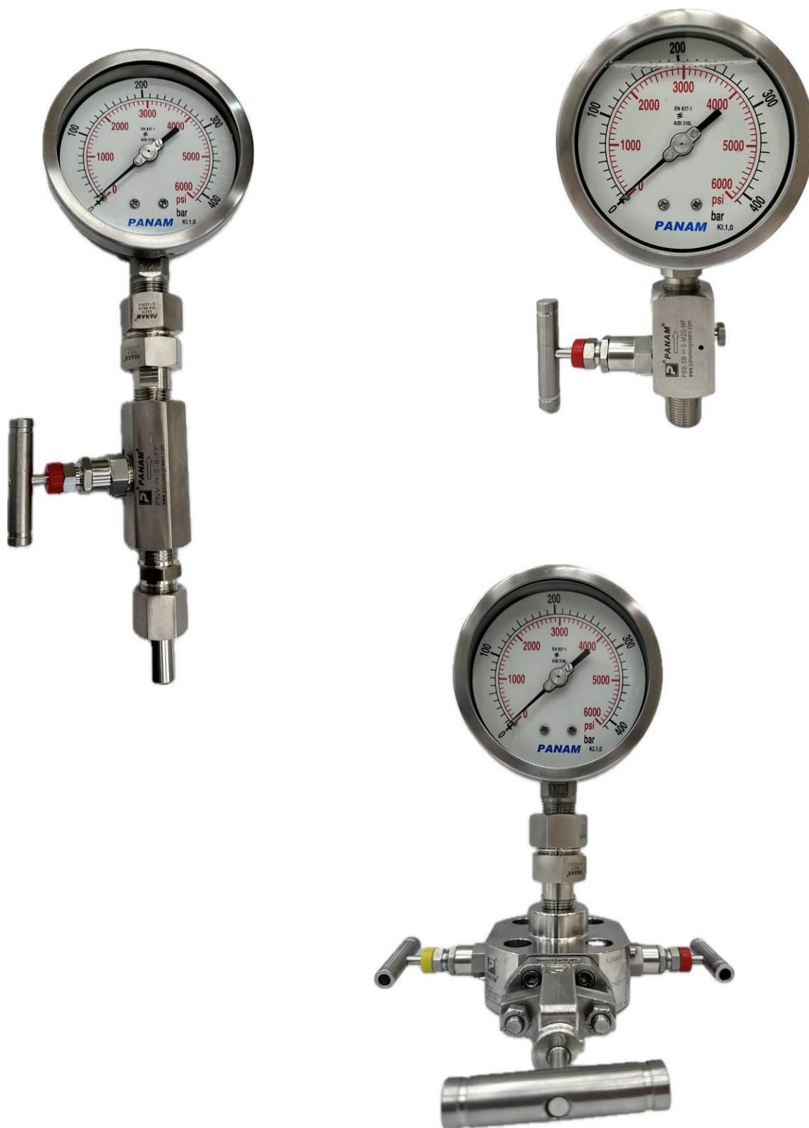
Рисунок 3 – варианты поставки манометров в комплекте с дополнительными изделиями.