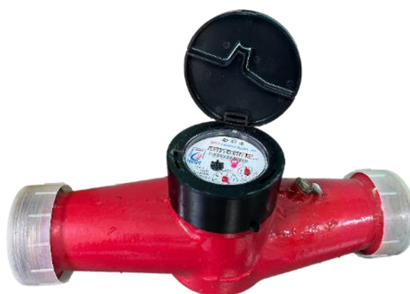
д) счётчик воды крыльчатый ЭКО НОМ исполнения СВДМ