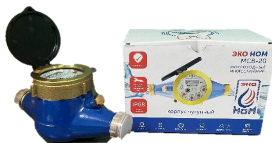
ж) счётчик воды крыльчатый ЭКО НОМ исполнения МСВ-М