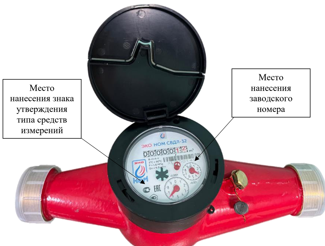
Рисунок 3 – Места расположения заводского номера и знака утверждения типа средств измерений

Метрологические и технические характеристики приведены в таблицах 1 – 8.