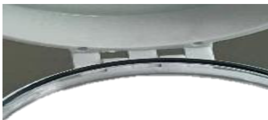
в) счётчик воды крыльчатый ЭКО НОМ исполнения СВД