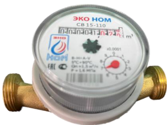
а) счётчик воды крыльчатый ЭКО НОМ исполнения СВ

Общий вид счётчиков представлен на рисунке 1.