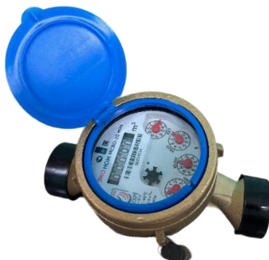
счётчик воды крыльчатый ЭКО НОМ исполнения МСВО