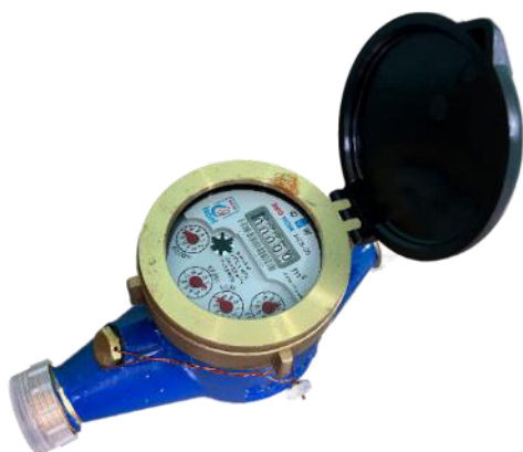
е) счётчик воды крыльчатый ЭКО НОМ исполнения МСВ