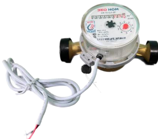
б) счётчик воды крыльчатый ЭКО НОМ исполнения СВ с импульсным выходным сигналом