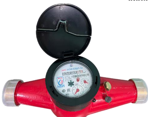
г) счётчик воды крыльчатый ЭКО НОМ исполнения СВДЛ