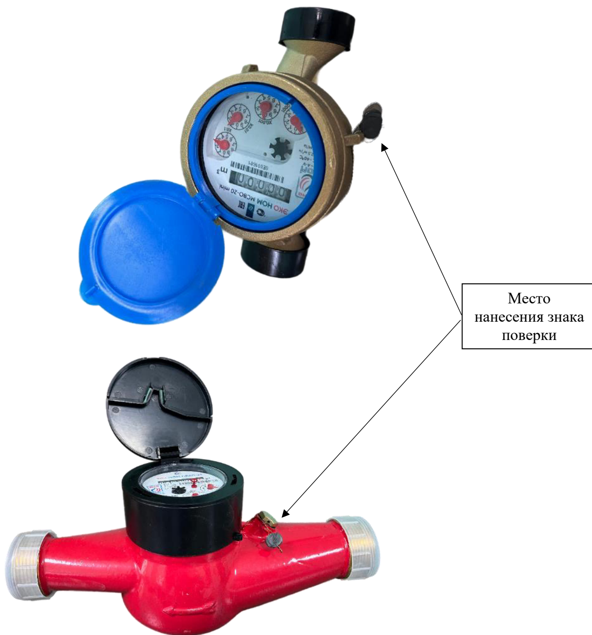
Рисунок 2 - Схема пломбировки от несанкционированного доступа и обозначение места нанесения знака поверки

Знак утверждения типа наносится методом штамповечати на лицевую панель счётчика. Заводской номер счётчика может содержать 2 латинских буквы и 6-7 арабских цифр, наносится на лицевую панель счётчика также методом штамповечати. Место нанесения знака утверждения типа средства измерений и место расположения заводского номера указаны на рисунке 3.