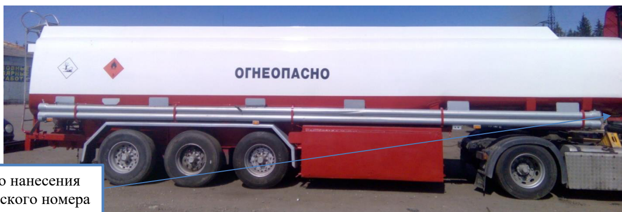
Рисунок 1 – Общий вид полуприцепа-цистерны HENDRICKS GOCH с указанием места нанесения заводского номера

Общий вид ППЦ с указанием места нанесения заводского номера приведен на рисунке 1.