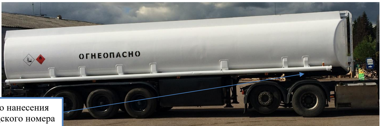
Рисунок 1 – Общий вид полуприцепа-цистерны ROHR-TAL-A-K с указанием места нанесения заводского номера

Общий вид ППЦ с указанием места нанесения заводского номера приведен на рисунке 1.