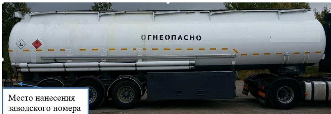
Рисунок 1 – Общий вид полуприцепа-цистерны LAG 03-34-TP с указанием места нанесения заводского номера

Общий вид ППЦ с указанием места нанесения заводского номера приведен на рисунке 1.