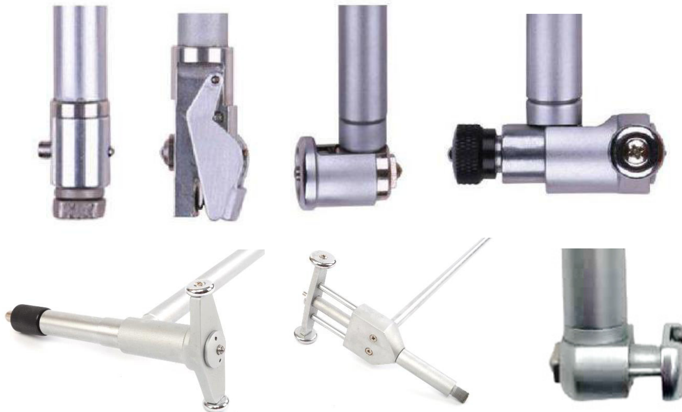
Рисунок 4 – Общий вид измерительных наконечников нутромеров