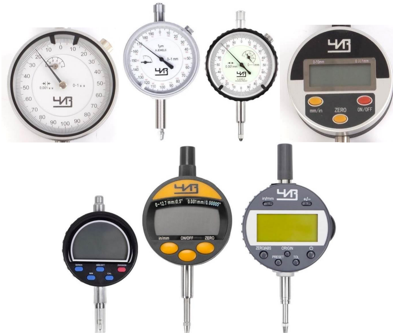
Рисунок 3 - Общий вид отсчетных устройств нутромеров