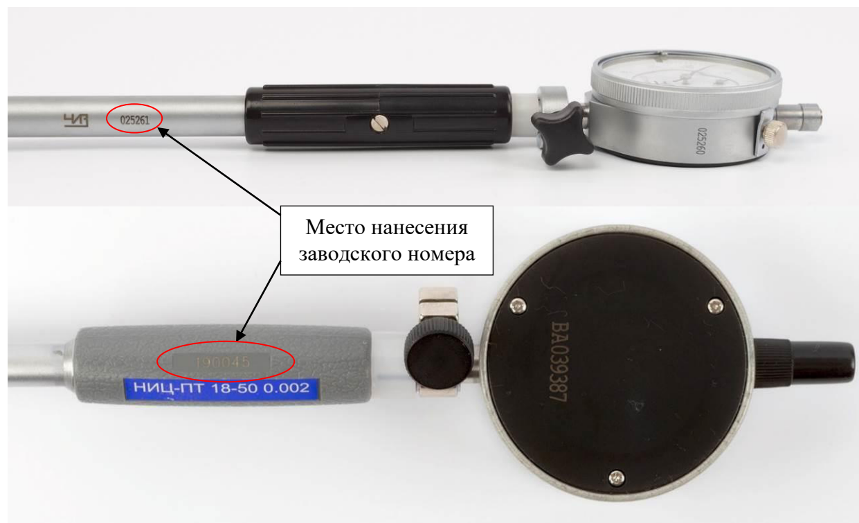
Рисунок 5 – Места нанесения заводских номеров на державке и удлинительном стержне нутромера