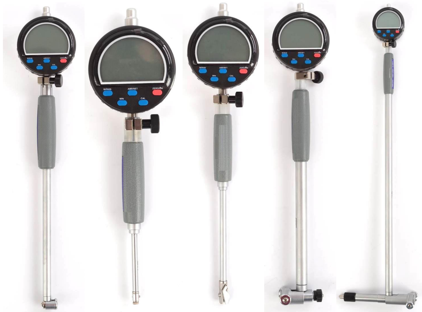
Рисунок 2 – Общий вид нутромеров модели НИЦ-ПТ