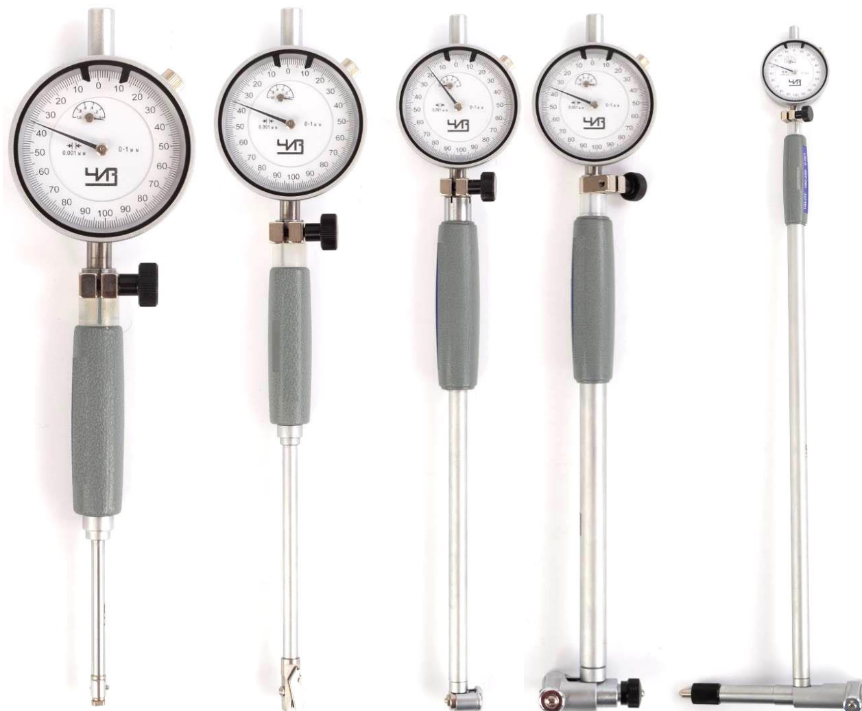
Рисунок 1 – Общий вид нутромеров модели НИ-ПТ

Пломбирование нутромеров от несанкционированного доступа не предусмотрено.