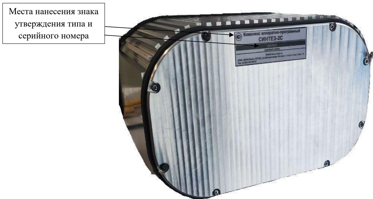
Рисунок 2 - Общий вид комплексов, обозначение мест нанесения серийного номера и знака утверждения типа

Пример маркировки комплексов представлен на рисунке 3.