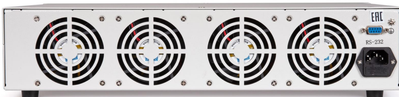
Рисунок 3 - Вид задней панели источников

Цвет корпуса источников может отличаться от представленного на рисунках.