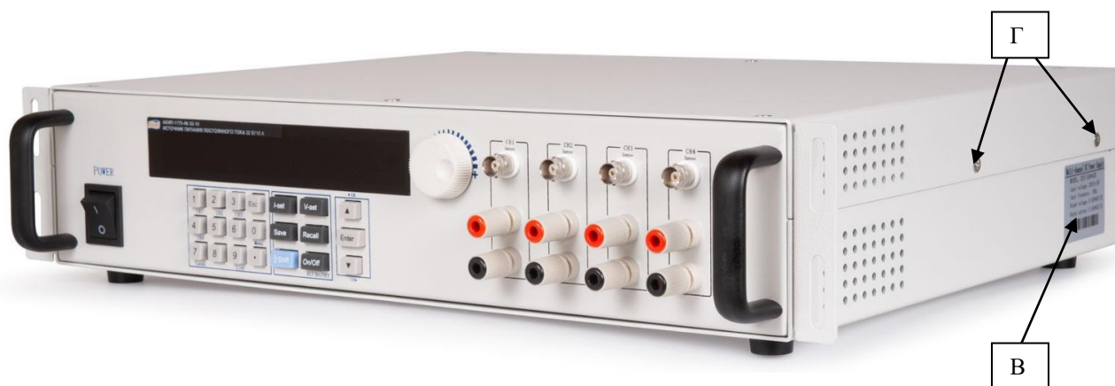
Рисунок 2 – Вид боковой панели источников с местами нанесения серийного номера (В) и пломбировки от несанкционированного доступа (Г)