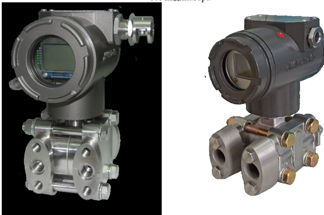
Рисунок 2 – Фотографии общего вида датчиков давления ДМ5017 фланцевого исполнения с индикатором