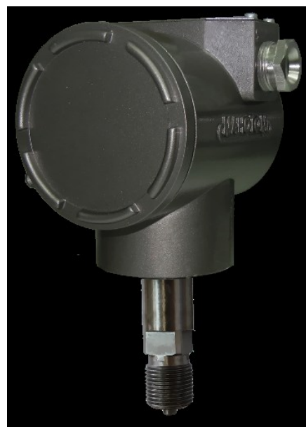
Рисунок 4 – Фотография общего вида датчиков давления ДМ5017 штуцерного исполнения без индикатора

Схема пломбирования от несанкционированного доступа внутрь датчиков давления ДМ5017 и место нанесения знака поверки приведены на рисунке 5.