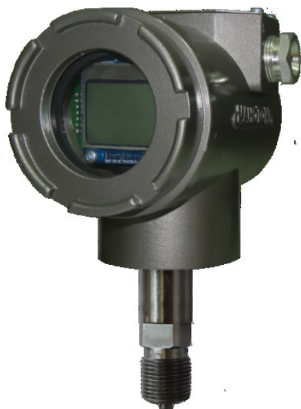
Рисунок 3 – Фотография общего вида датчиков давления ДМ5017 штуцерного исполнения с индикатором