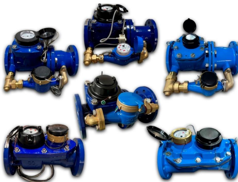
Рисунок 1 – Общий вид счетчиков холодной воды комбинированных ПУЛЬСАР

Заводской номер в цифровом формате наносится на счетчики любым способом, обеспечивающим сохранность номера во время всего срока эксплуатации.