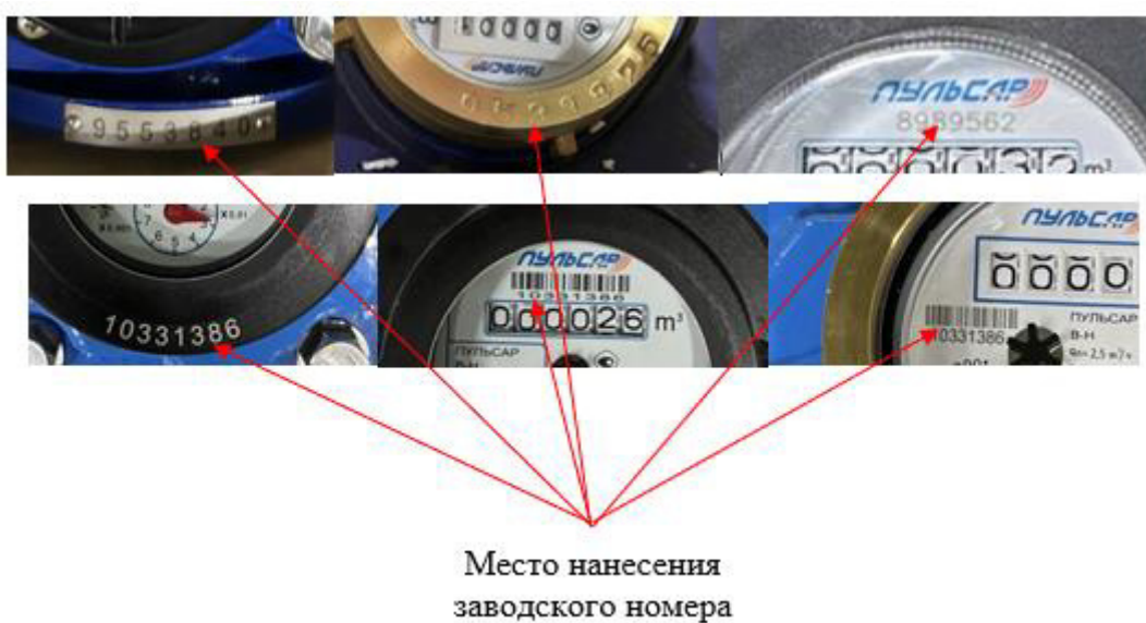
Рисунок 4 – Обозначение мест нанесения заводского номера