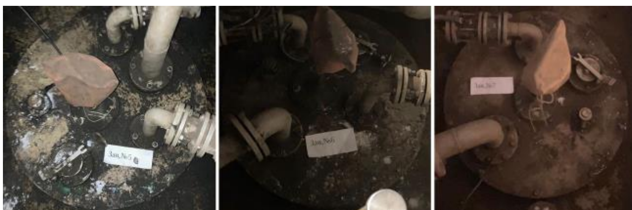
Рисунок 4 – Горловины резервуаров РГС-25 зав.№№ 5, 6, 7

Пломбирование резервуаров РГС-25 не предусмотрено.