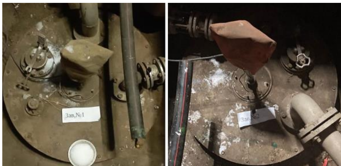
Рисунок 2 – Горловины резервуаров РГС-25 зав.№№ 1, 2