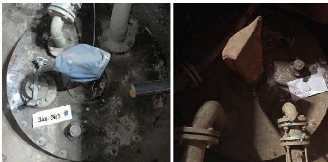
Рисунок 3 – Горловины резервуаров РГС-25 зав.№№ 3, 4