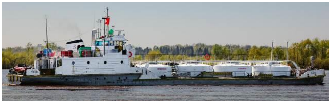
Р и с у н о к 1 – Общий вид танкера ТНМ-31

Общий вид танкера ТНМ-31 представлен на рисунке 1.