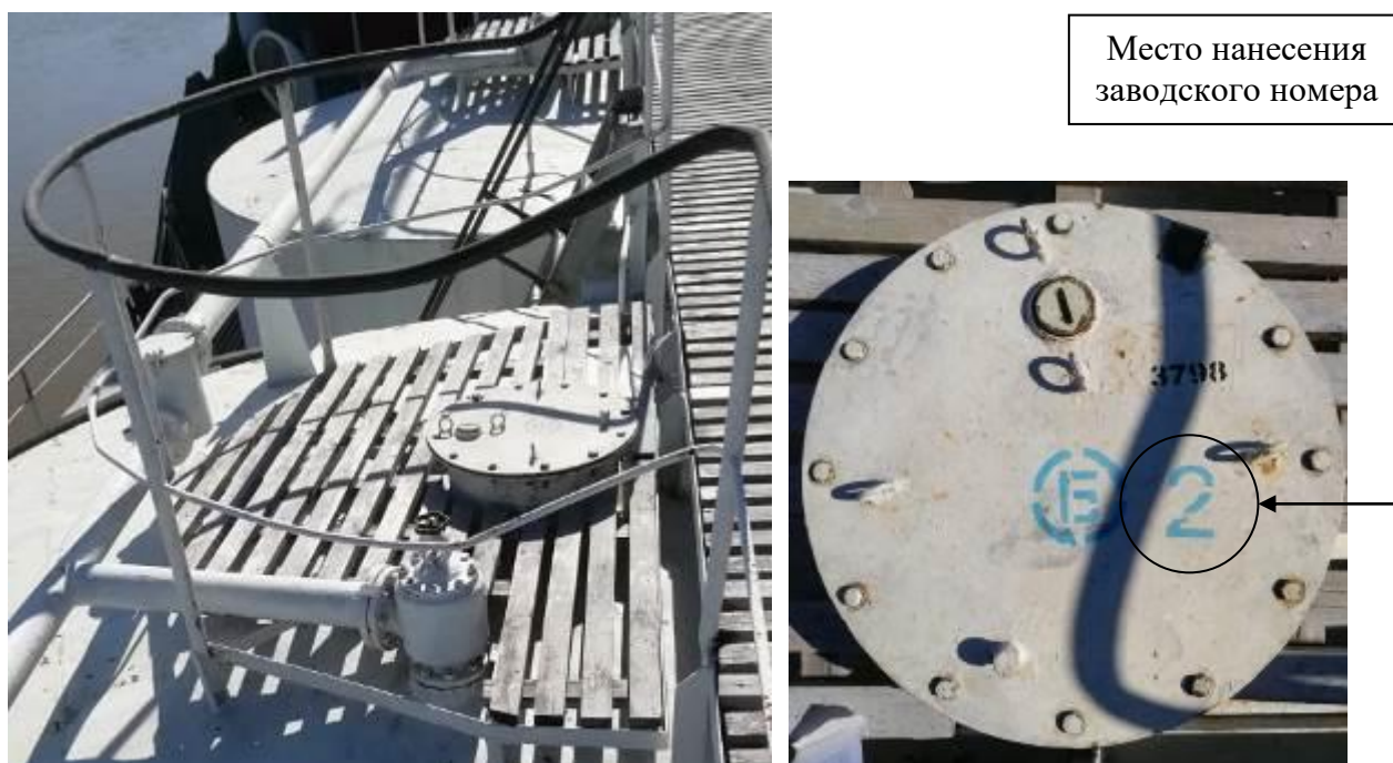
Р и с у н о к 3 – Общий вид замерного люка и места нанесения заводского номера

Заводские номера в виде цифровых обозначений, обеспечивающие идентификацию каждого экземпляра средств измерений, нанесены на замерные люки танков методом окраса. Общий вид замерного люка и место нанесения заводского номера представлены на рисунке 3.