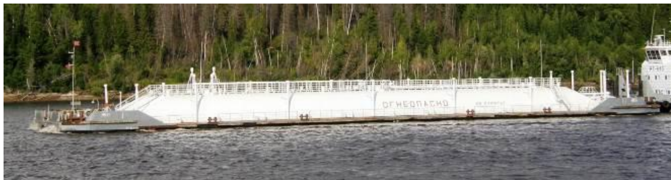
Р и с у н о к 1 – Общий вид нефтеналивной баржи НБ-11

Общий вид нефтеналивной баржи НБ-11 представлен на рисунке 1. Схематичное расположение танков на палубе нефтеналивной баржи НБ-11 представлено на рисунке 2.